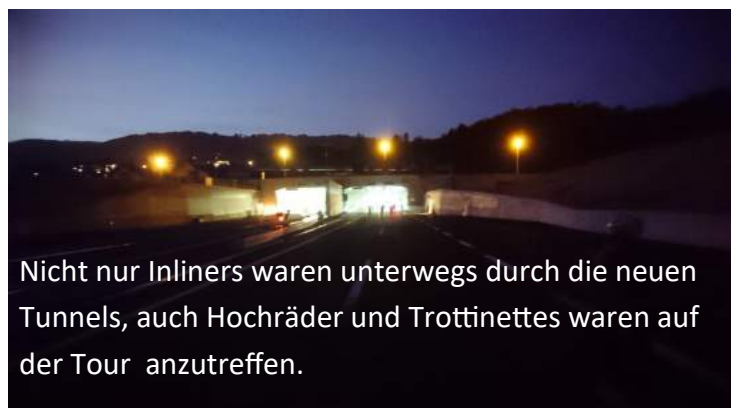
Nicht nur Inliners waren unterwegs durch die neuen Tunnels, auch Hochräder und Trottinettes waren auf der Tour anzutreffen.