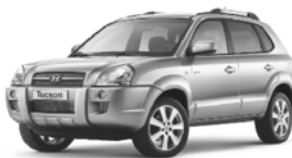
Tucson Silversky 2.0 CRDi 4x4 mit Sonderausstattung für nur Fr. 39'990.-. Ihr Preisvorteil: Fr. 5'100.-*.