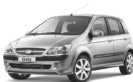
Getz Silversky 1.6 mit Sonderausstattung für nur Fr. 23'290.-. Ihr Preisvorteil: Fr. 2'700.-*.

Der Deutsche unter den Asiaten präsentiert: