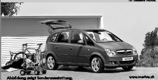
Abbildung zeigt Sonderausstattung.